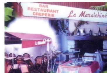
La Garette - 05 49 35 93 49