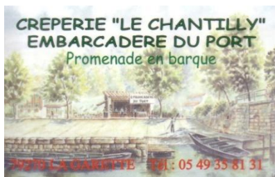
La Garette – 05 49 35 81 31